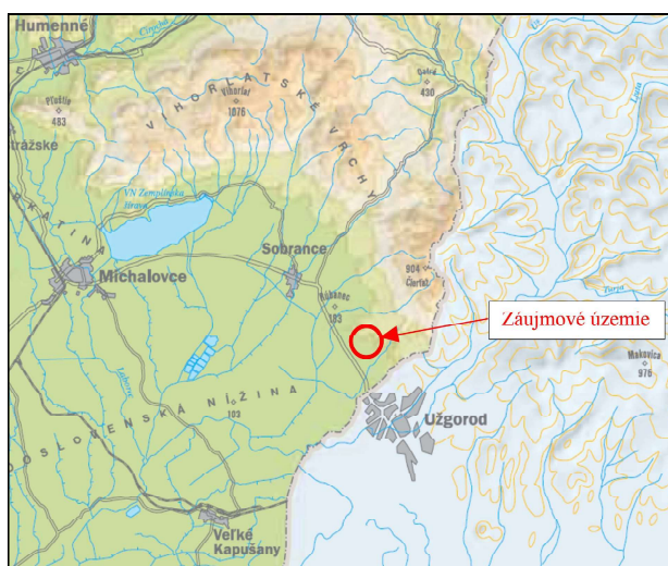
Obrázok 1: Zaujmové územie v geomorfologickom členení

Rozhranie Podvihorlatskej pahorkatiny a Sobraneckej roviny ako aj samotná Východoslovenská nížina predstavuje intenzívne poklesávajúcu panvu. Sedimenty redeponované z okolitých pohorí tvoria íly, piesky, štrky, čiastočne tufy a tufity. Jednotlivé tektonické kryhy tvoriace panvu nepoklesávali rovnomerne. Poklesnutú časť územia až po Seniansku depresiu vyplňujú veľmi silné miestami až 60 m mocné polohy kvartérnych štrkov, ílov a pieskov. Na povrchu ich prekrývajú pokrovy spraší a sprašových hĺn –Sobranecká rovina. Podvihorlatská pahorkatina je prekrytá až 30 m mocným komplexom náplavových kužeľov. Poklesy vo Východoslovenskej nížine majú za následok aj vejárovitý tvar riečnej siete. Kvartérny pokry odráža geologickú stavbu predkvartérneho podložja. Kvartérne sedimenty vystupujú v horskej časti Vihorlatských vrchov, kde ich reprezentujú najmä hlinito-kamenité sedimenty pleistocénu a holocénu. V podhorskej časti Vihorlatských vrchov sú značne rozšírené pleistocénne deluviálno-fluviálne sedimenty, fluviálne, eolicko-deluviálne a proluviálne sedimenty. V ich horskej časti sú rozšírené aj soliflukčné a gravitačné sedimenty. Geomorfologické a geologické procesy počas kvartéru sformovali depresie a prepadliny, vyplnené najmä mocným súvrstvom fluviálnych a proluviálnych sedimentov.