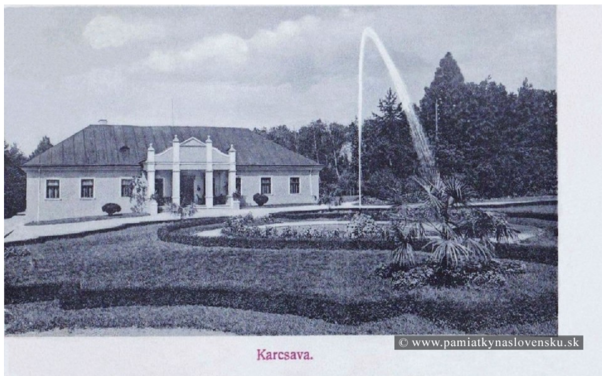
Obrázok č. 1 – Kúria Krčava

K historickým pamätihodnostiam a miestnym zaujímavostiam patria dnes už len pozostatky kúrie – kaštieľa po grófovi Gutmanovi. Pripomienkou tohto obdobia, kedy v obci pôdu vlastnili veľkostatkári a poskytovali prácu dobrovoľníkom sú obrázky č. 1 a 2.