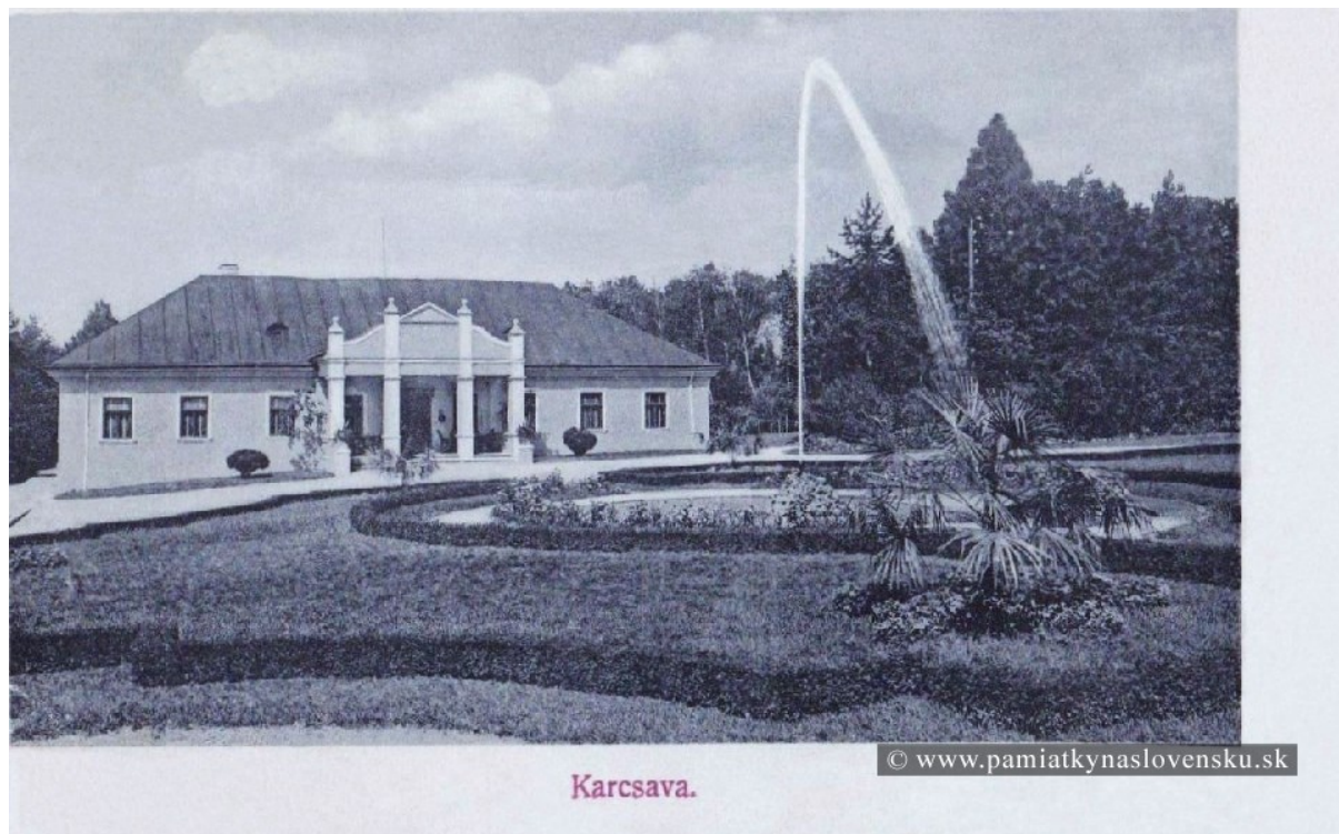
Obrázok č. 1 – Kúria Krčava

K historickým pamätihodnostiam a miestnym zaujímavostiam patria dnes už len pozostatky kúrie – kaštieľa po grófovi Gutmanovi. Pripomienkou tohto obdobia, kedy v obci pôdu vlastnili veľkostatkári a poskytovali prácu dobrovoľníkom sú obrázky č. 1 a 2.